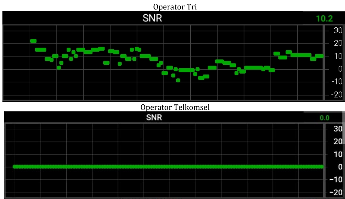
Gambar 3. Perbandingan Nilai SINR Operator Tri dan Telkomsel

SINR merupakan rasio perbandingan sinyal yang dipancarkan terhadap interferensi dan noise yang ada (tercampur dengan sinyal utama). Berdasarkan pengukuran maka didapatkan nilai SINR dari kedua operator sebagai berikut: