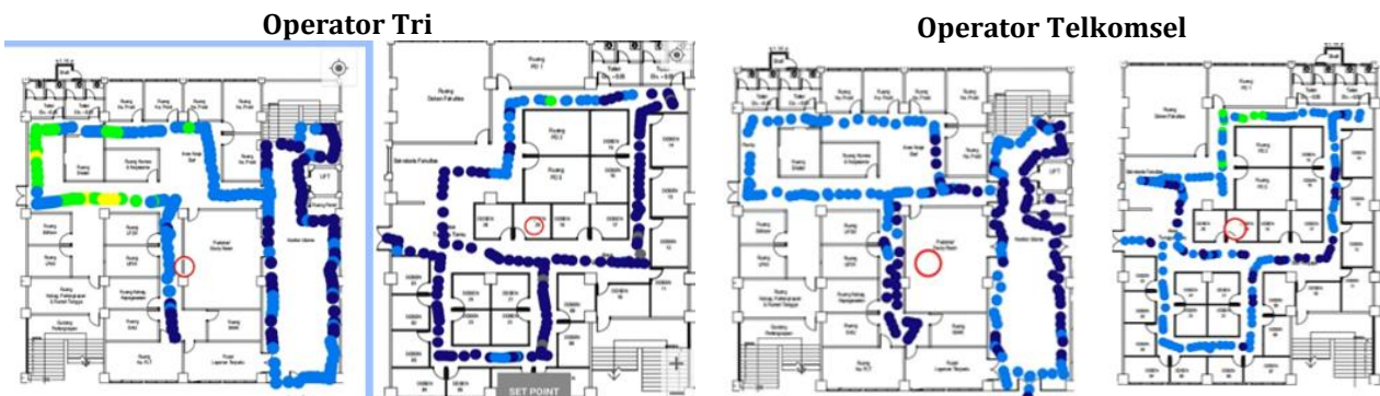
Gambar 2. Perbandingan Nilai RSRP Operator Tri dan Telkomsel

RSRP merupakan parameter yang digunakan untuk melihat kekuatan sinyal yang dipancarkan eNodeB ke MS yang diterima user. Berdasarkan hasil pengukuran maka didapatkan nilai RSRP dari kedua operator sebagai berikut :