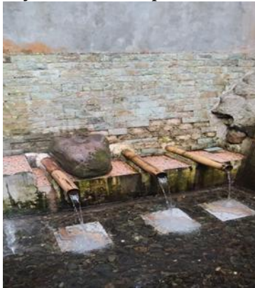
4. Pancur pemandian Aek poso poso, artinya Pancur Pemandian air untuk bayi yang telah lahir.