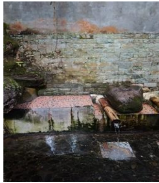
3. Pancur pemandia Aek Namarbaju, yaitu Pancur pemandian untuk anak gadis.