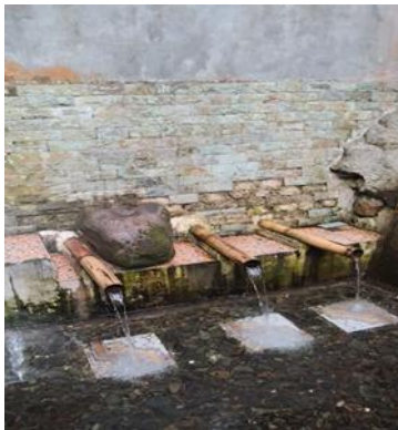
5. Pancur pemandian pangulu raja, yaitu Pancur pemandian untuk mencari jabatan, pangkat, kepintaran dan kesuksesan.