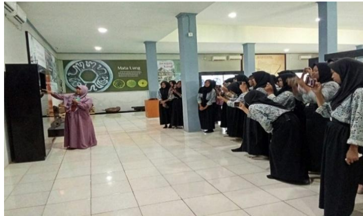
Gambar 1. Kegiatan Kunjungan Edukatif Peserta Didik di Museum Situs Kepurbakalaan Banten Lama

Selain data observasi dan wawancara, hasil penelitian juga diperkuat melalui penyebaran angket kepada 57 peserta didik dari empat SMA di Kota Serang yang telah melakukan kunjungan edukatif ke Museum Situs Kepurbakalaan Banten Lama. Berdasarkan hasil angket, sebagian besar peserta didik memberikan respons positif terhadap pemanfaatan museum sebagai sumber belajar sejarah. Sebanyak 99,29% peserta didik menyatakan setuju dan sangat setuju bahwa museum membantu memperjelas serta mengonkretkan materi sejarah yang dipelajari di kelas. Hal tersebut menunjukkan bahwa interaksi langsung dengan koleksi museum memberikan pengalaman belajar yang lebih nyata dan kontekstual bagi peserta didik.