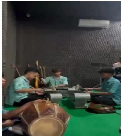
Gambar 1. Pembelajaran dengan metode Etnopedagogi di MAN 2 Magelang

Kearifan lokal merupakan pedoman dan berbagai aktivitas kognitif yang diaplikasikan sebagai suatu strategi dalam menyikapi problematika ataupun langkah pemenuhan kebutuhan bermasyarakat lokal. (Njatrijani, 2018, p. 17) menjelaskan bahwa, kearifan lokal atau local wisdom terdiri dari dua suku kata, yakni kearifan atau kebijaksanaan ( wisdom ) dan lokal atau tradisional ( local ) dapat diartikan sebagai ruang tempat yang terbatas sehingga dapat dimaknai sebagai penyikapan atau kebijaksanaan, pengetahuan dan kecerdasan setempat. Konteks budaya sebagai kearifan lokal yang memberikan kontribusi dalam bentuk inovasi dan keterampilan yang ditujukan untuk pengembangan potensi suatu kelompok individu. Berikut ini merupakan ilustrasi proses pembelajaran dengan metode etnopedagogi di MAN 2 Magelang;