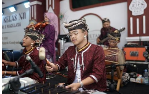
Gambar 2. Proses implementasi nilai Tawasut dalam kolaborasi siswa dan Sultan Mandama Gamelan Kontemporer