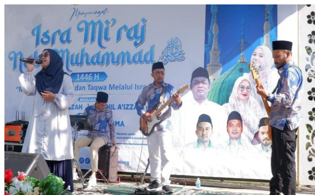
Gambar 5. Penampilan Sultan Mandama Gamelan Kontemporer dalam rangka memperingati Isra Mi'raj di MAN 2 Magelang

Secara harafiah, peranan musik dalam pembelajaran di madrasah tidak hanya sebatas sebagai hiburan saja, akan tetapi dalam aspek pedagogis dan kultur sangat efektif dalam menggali potensi anak, menciptakan rasa percaya diri siswa, pembentukan karakter, media dalam pembelajaran agama dan berperan penting dalam sikap moderasi beragama. Berdasarkan wawancara yang dilakukan pada hari Kamis, 26 Januari 2026 dengan Muhammad Ilyaz, S.Pd. selaku guru Sejarah Kebudayaan Islam di MAN 2 Magelang serta personil dari Sultan