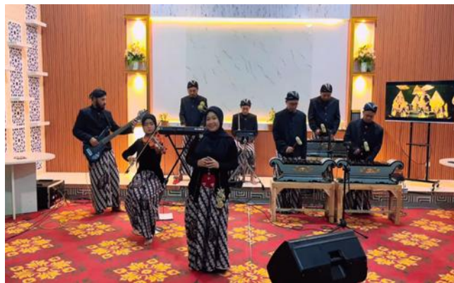
Gambar 4. Penampilan Sultan Mandama Gamelan Kontemporer

Sumarsono (2024, p. 77) menjelaskan bahwa, beberapa instrumen musik modern dengan tradisi dikombinasikan diharapkan mampu memberikan prespektif sudut pandang tentang keberagaman, saling menghargai dan kolaborasi dalam rumpun kehidupan masyarakat yang lebih humanis. Adapun lagu yang dibawakan akan memberikan stimulus yang berkaitan dengan lagu-lagu tradisi Jawa yang notabene sebagai langkah konservasi pelestarian Bahasa Ibu (komunikasi dasar dan identitas budaya) agar siswa tidak melupakan bahasa asli nenek moyangnya khususnya bahasa Jawa. Kemudian Sultan Mandama tersebut akan memberikan stimulus ear training , cara cepat dalam menghafal kosakata berbahasa Arab melalui media musik, khususnya pada lagu-lagu religi disetiap pertunjukannya. Selain itu, Sultan Mandama memberikan suatu pembelajaran tentang berapresiasi dalam suatu pertunjukkan, hal tersebut diharapkan mampu mengenalkan siswa tentang aspek menghargai dan toleransi antar individu atau kelompok satu sama lain di MAN 2 Magelang. Berikut ini merupakan contoh ilustrasi internalisasi nilai-nilai penguatan moderasi beragama oleh Sultan Mandama Gamelan Kontemporer di MAN 2 Magelang dapat dilihat pada gambar 1 dan 2.