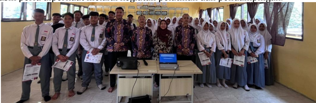
Gambar 2. Kegiatan Pelatihan

Berdasarkan Tabel 1 diketahui bahwa kondisi awal pemahaman peserta mengenai etika digital masih didominasi oleh kategori cukup dengan jumlah 50 peserta atau sebesar 62,5%. Peserta yang memperoleh kategori bagus berjumlah 18 orang atau sebesar 22,5%, sedangkan 12 peserta atau 15% berada pada kategori tidak cukup. Nilai rata-rata kemampuan awal peserta sebesar 58,7 yang menunjukkan bahwa pemahaman mengenai etika digital dan literasi digital masih perlu diperkuat melalui kegiatan pelatihan dan pendampingan.