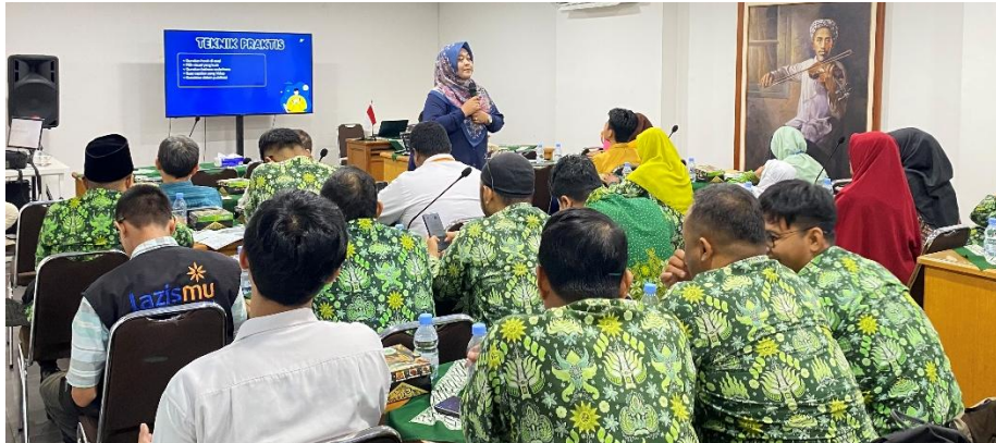
Gambar 2. Penyampaian Materi Jurnalistik

pengalaman dalam pengelolaan redaksi majalah secara sistematis. Pelatihan dilaksanakan melalui ceramah interaktif, diskusi kelompok, simulasi wawancara, dan praktik langsung penulisan berita. Materi yang diberikan meliputi teknik penulisan berita, penulisan opini dan feature, teknik wawancara, penyuntingan naskah, tata kelola redaksi, serta strategi publikasi digital. Peserta juga memperoleh pendampingan dalam penyusunan rubrik majalah dan tata letak publikasi digital.