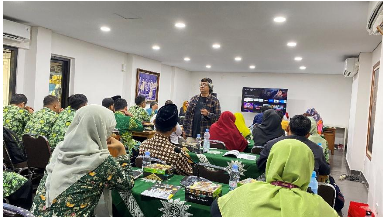
Gambar 3. Pendampingan Tata Kelola Redaksi dan Publikasi Digital

Kegiatan pendampingan juga difokuskan pada peningkatan kualitas konten dan desain publikasi majalah. Peserta diberikan praktik penyusunan rubrik majalah, teknik penyuntingan bahasa, serta pengelolaan tata letak majalah agar lebih menarik dan mudah dipahami pembaca. Selain itu, peserta mulai memanfaatkan aplikasi desain digital sederhana untuk mendukung pembuatan poster dakwah, tata letak majalah, dan publikasi konten melalui media sosial organisasi. Hasil pendampingan menunjukkan adanya perubahan positif dalam pengelolaan media dakwah Al-Fajr. Struktur redaksi menjadi lebih sistematis dan terorganisasi, pembagian tugas redaksi berjalan lebih jelas, serta proses penerbitan majalah menjadi lebih terarah. Peserta juga mulai memahami pentingnya konsistensi penerbitan, kualitas konten, dan strategi publikasi digital untuk memperluas jangkauan informasi dakwah kepada masyarakat. Selain itu, penggunaan media sosial dan platform digital mulai dimanfaatkan sebagai sarana publikasi dan distribusi informasi organisasi secara lebih efektif.