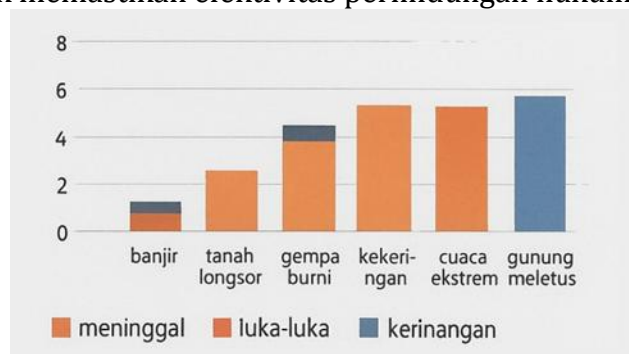
Gambar 2. Bencana Indonesia 2021 dan Jumlah Kejadian, Jenis, Dampak

Perempuan dan kelompok rentan seperti anak-anak, lansia, dan penyandang disabilitas sering kali mengalami dampak yang lebih berat dalam situasi bencana dibandingkan dengan kelompok lainnya (Ariyanto, 2020). Vulnerabilitas ini disebabkan oleh berbagai faktor struktural dan kultural yang telah mengakar dalam masyarakat Indonesia, termasuk ketimpangan gender, keterbatasan akses terhadap sumber daya, serta minimnya partisipasi dalam proses pengambilan keputusan. Kondisi ini memerlukan perhatian khusus dalam kerangka hukum operasional keadaan darurat yang dapat memberikan perlindungan memadai bagi kelompok-kelompok tersebut. Kerangka hukum Indonesia telah mengamanatkan perlindungan terhadap kelompok rentan melalui berbagai instrumen legal, termasuk UU No. 24 Tahun 2007 tentang Penanggulangan Bencana yang secara eksplisit menyebutkan perlunya perhatian khusus terhadap kelompok rentan (Pratama, 2021). Namun demikian, implementasi praktis dari ketentuan hukum ini masih menghadapi berbagai tantangan, terutama dalam hal koordinasi antar lembaga, alokasi sumber daya, dan mekanisme operasional di lapangan. Gap antara norma hukum dan implementasinya menjadi permasalahan krusial yang perlu dikaji secara mendalam untuk memastikan efektivitas perlindungan hukum bagi kelompok rentan.