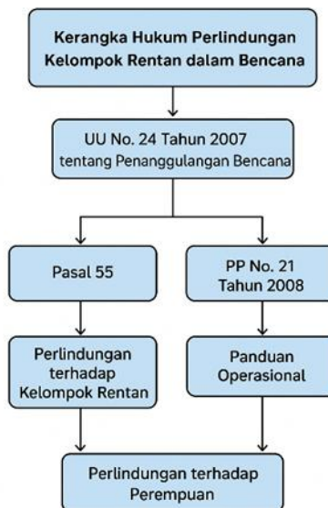
Gambar 3. Kerangka Hukum Perlindungan Kelompok Rentan dalam Bencana

Dari aspek operasional, pengembangan standar operasional prosedur (SOP) yang spesifik untuk penanganan kelompok rentan dalam setiap fase penanggulangan bencana menjadi prioritas. SOP ini harus mencakup prosedur identifikasi kelompok rentan, mekanisme evakuasi yang aksesible, pengelolaan shelter yang responsif gender, dan sistem distribusi bantuan yang mempertimbangkan kebutuhan khusus kelompok rentan (Wulandari, 2022). Implementasi SOP ini perlu didukung dengan pelatihan regular bagi semua stakeholder yang terlibat dalam penanggulangan bencana. Pengembangan sistem monitoring dan evaluasi yang robust juga menjadi kunci untuk memastikan efektivitas dan akuntabilitas sistem perlindungan. Sistem ini harus mencakup indikator-indikator yang spesifik untuk mengukur efektivitas perlindungan kelompok rentan, mekanisme complaint handling yang mudah diakses, dan sistem feedback yang memungkinkan continuous improvement (Santoso, 2023). Partisipasi kelompok rentan dalam sistem monitoring dan evaluasi ini juga perlu diperkuat untuk memastikan bahwa suara mereka didengar dan ditindaklanjuti.