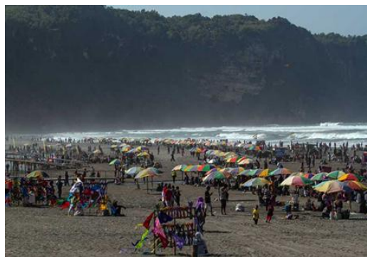
Gambar 4. Kondisi Kawasan Pantai Parangtritis sebelum Penertiban