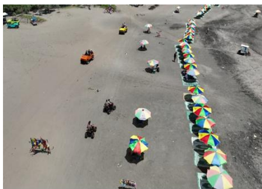
Gambar 5. Kondisi Kawasan Pantai Parangtritis sesudah Penertiban