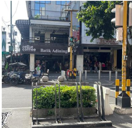
Gambar 2. Fasilitas pelican crossing atau Alat Pemberi Isyarat Lalu Lintas (APILL) pejalan kaki atau lampu lalu lintas penyeberangan jalan