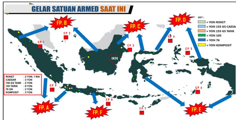
Gambar 1. Gelar Satuan Armed Saat Ini

Kalimantan Utara (BNPP, 2024). Namun, keberhasilan pengamanan pulau terdepan tidak hanya ditentukan oleh jumlah dan kualitas alutsista, tetapi juga oleh kemampuan manuver strategis satuan Armed dalam mengantisipasi dan merespons setiap eskalasi ancaman. Oleh karena itu, strategi peningkatan gelar satuan Armed di wilayah ini perlu memadukan aspek kesiapsiagaan tempur, penempatan yang fleksibel, dan dukungan logistik berkelanjutan agar mampu memberikan efek pertahanan yang optimal.